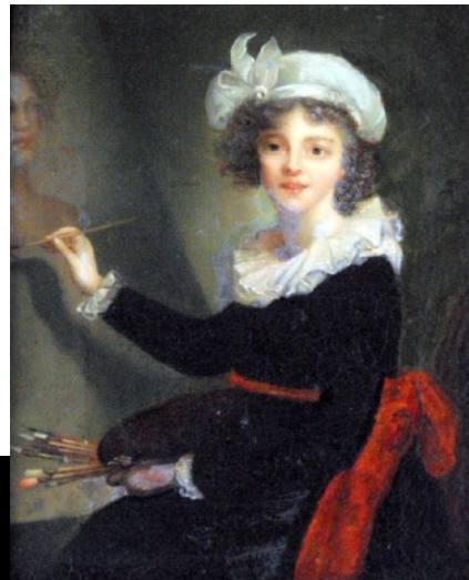
Elisabeth Vigée-Lebrun (1755-1842), 1790